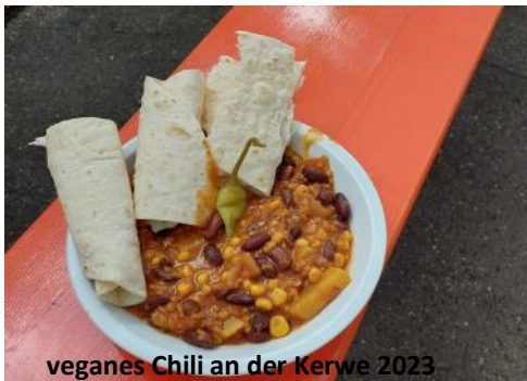
veganes Chili an der Kerwe 2023

Weitere Termine in 2024 sind: Freitag 05. Juli und Freitag, 04. Oktober. Also: Hoschd schunn g'herd?